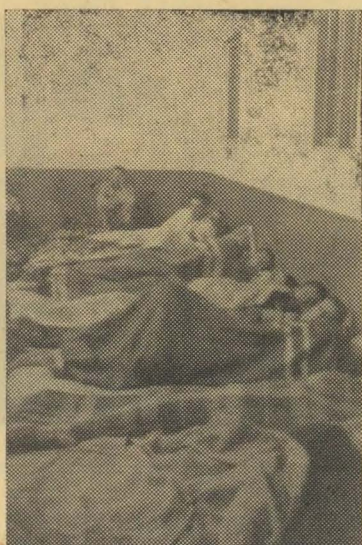
'n Massa-slaap gedurende die Alabama-toer.