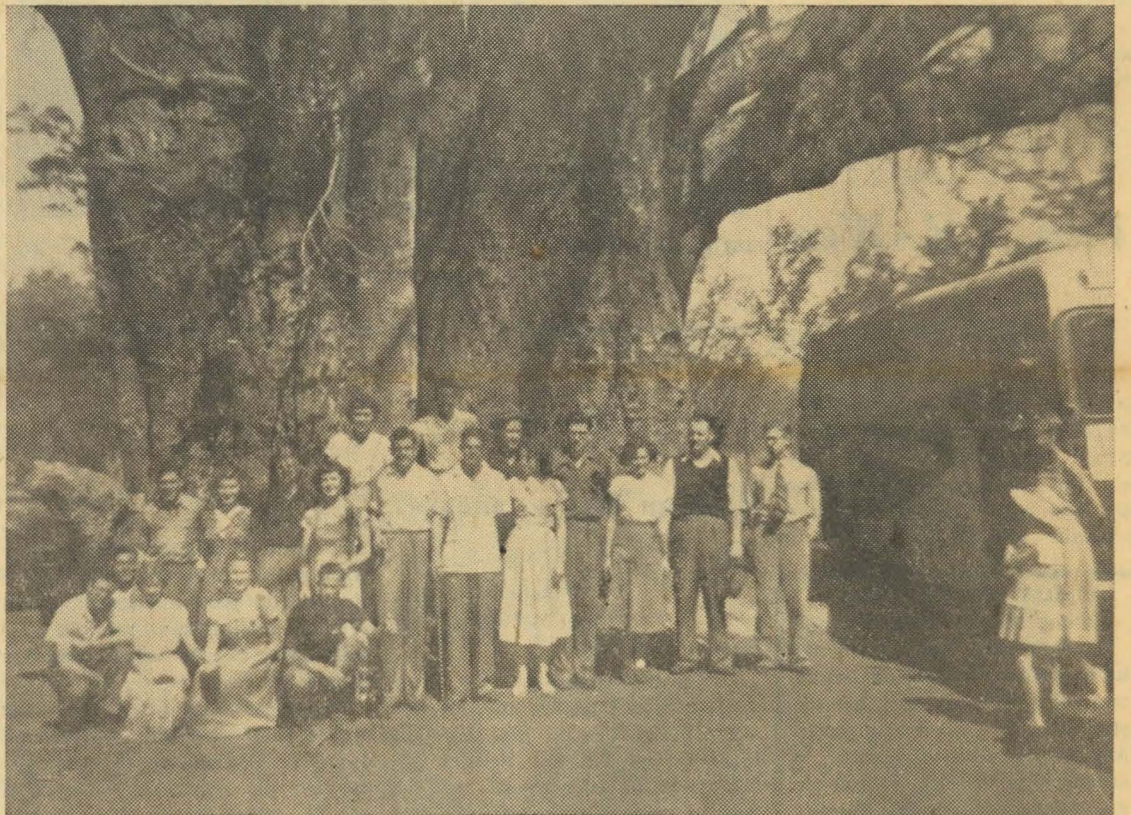
Die hele geselskap van die Alabama-toer, afgeneem onderwyl die bus 'n bietjie „blaas.”