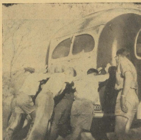
Op die meegaande foto kan gesien word hoe 'n paar Alabama - lede noodgedwonge die bus teen 'n stylte uithelp.