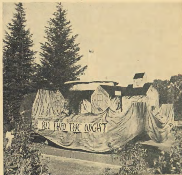
„All through the night”—die vlot wat bekroon is as die oorspronklikste tydens Vreugdedag.

Op Maandagaand 3 Julie vind die jaarlikse dinee van die kongres plaas.