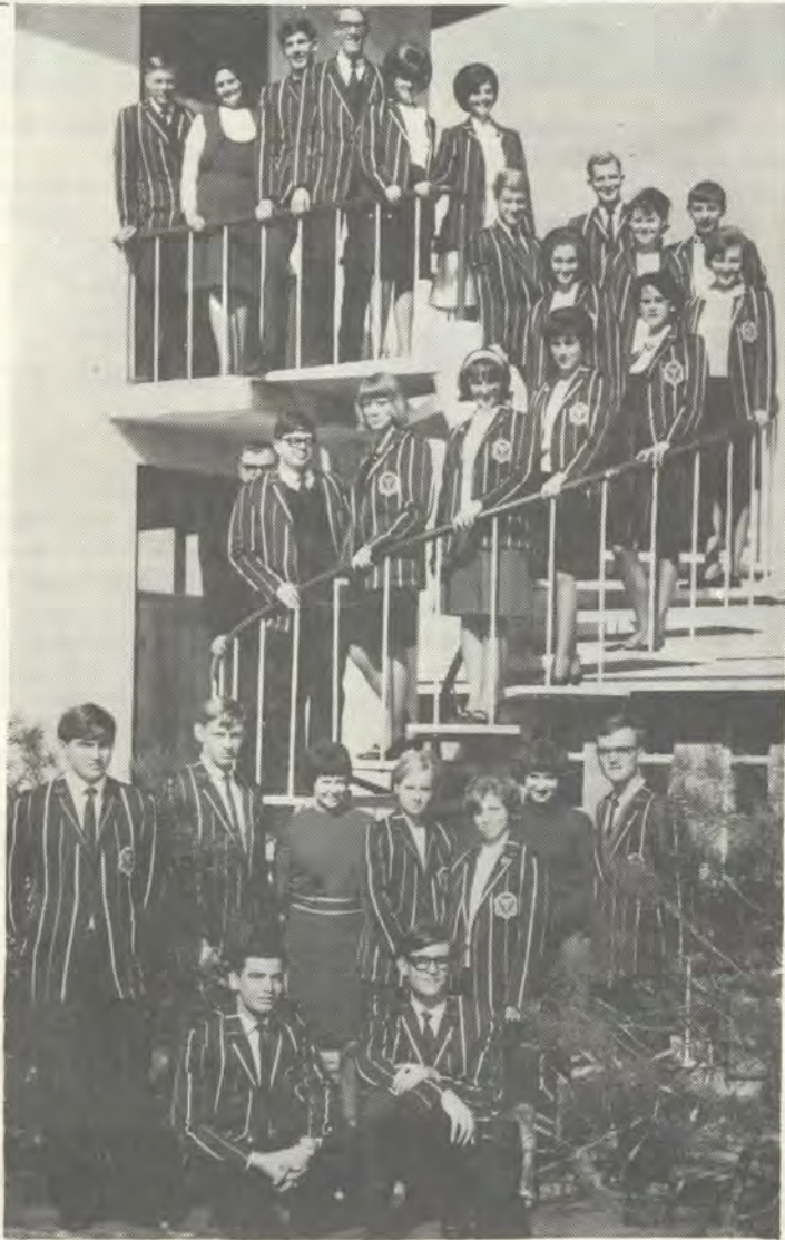
Thalia gaan gedurende die eerskomende vakansie met hulle toneelstuk deur verskeie dele van die land toer. Op die foto bo verskyn die toneelgroep wat oor twee weke in die langpad val.