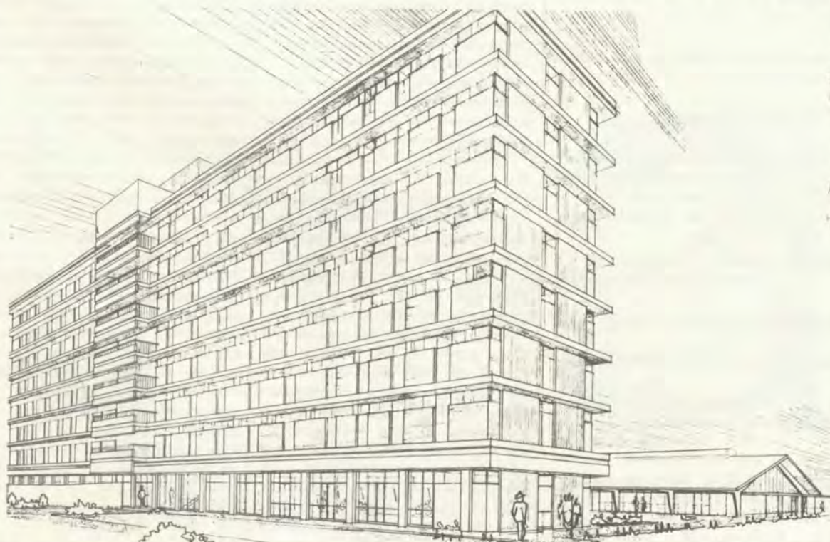
So sal die nuwe dameskoshuis van die P.U., wat teen 'n koste van R720,000, aangebou word, lyk. Die dameskoshuis sal 250 dames kan huisves. Lees berig elders.