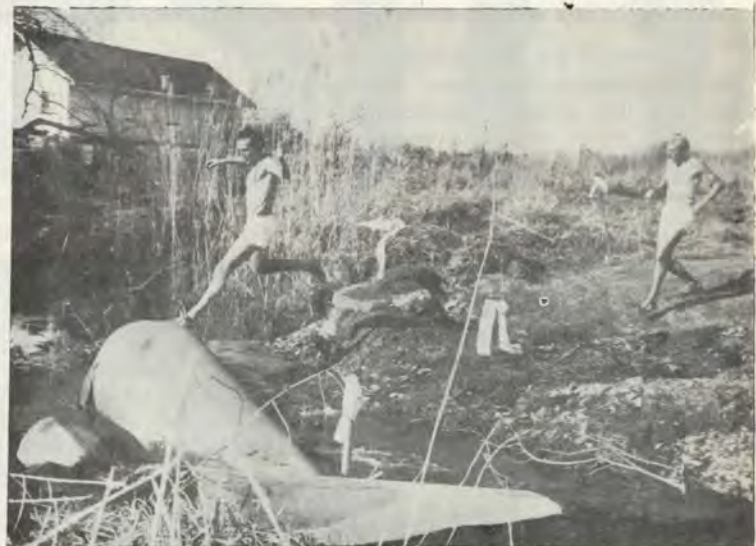
Fanie van Zyl spring oor 'n strompie water terwyl Andries Krogman gereet maak om dieselfde te doen. Dit foto is geneem tydens die Intervarsity-landloop wat deur die Pukke gewen is. Ses mans het hulle vasgehou terwyl hulle die wenstreep eerste oorsteek.