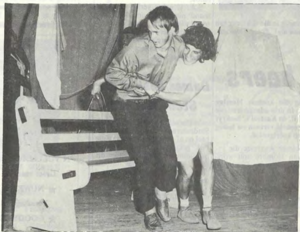
Woensdagaand voor Intervarsity is 'n aantal sleepbankies formeel ingewy. Hier sluijp die eerste gebruikers na veiliger oorde.