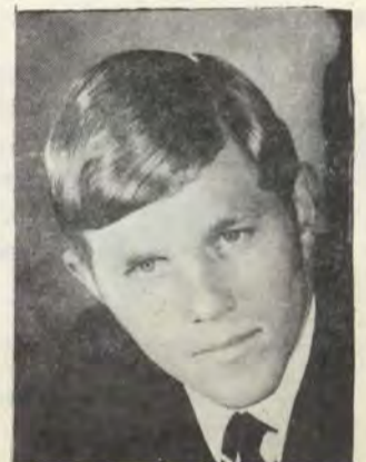
K.V.V. Florna (sekretaris). Alabama.

1967 Th. B. II. 1968 A.O.B. (sekretaris).