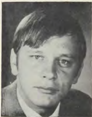
komitee (Puk verteenwoordiger). A.S.B. Kongres (Waarnemer). Reklamekomitee.

1969 Voorsitter van Nasionale Skakelkomitee van handelstudente. Nasionale Handelstudente-