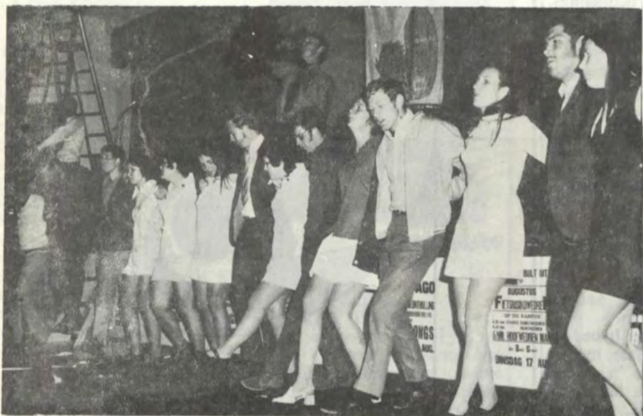
'n Ry singende Pukke tydens die sing-songs wat voor Intervarsity gehou is.