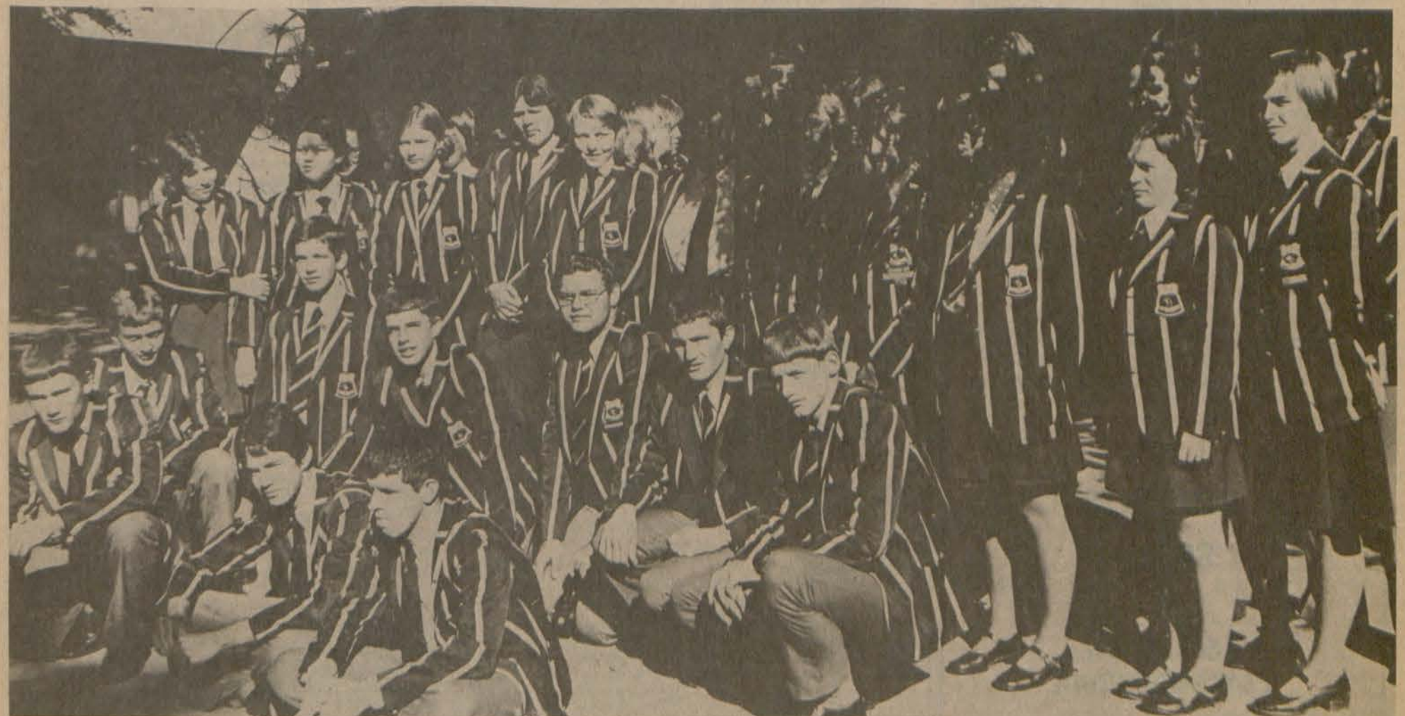
Onlangs het hierdie groep leerlinge van die Windhoekse Hoërskool die Puk besoek. Die vraag is hoe goed gaan die Suidwester volgende jaar op die Puk verteenwoordig wees.