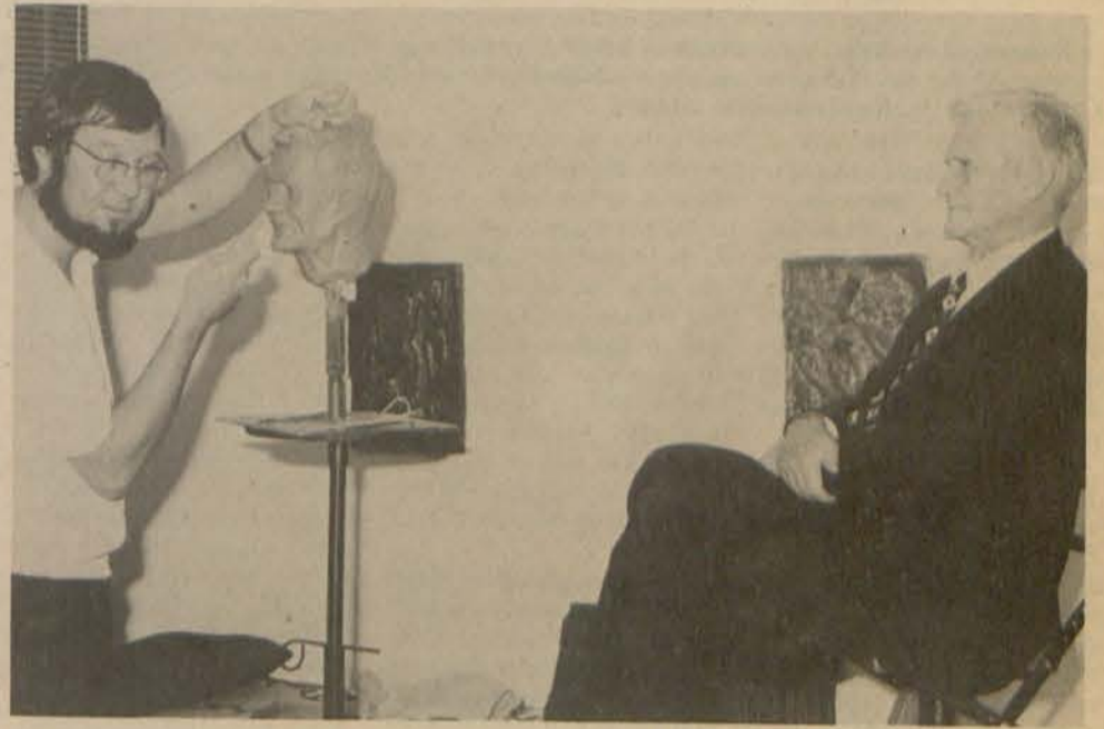
'n Blywende erfenis vir die PUK deur die beeldhouer, Barend Grobbelaar.