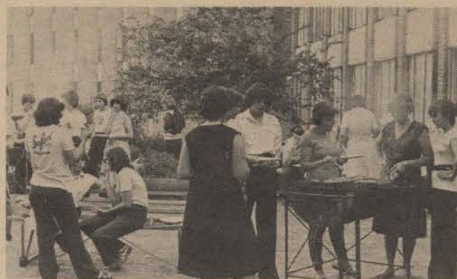
Die dames van Wag-'n-Bietjie ag interne skakeling as baie belangrik vir koshuisgees. 'n Braaivleis is hiervoor die middel tot die doel.

Manskoshuise moet kennis neem van die nuwe uittekenstelsel. Dit is geskoei op die voorstelle van primarias tydens die Kampusfokuskamp.