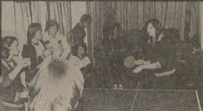
Die dames van Kulu in aksie tydens 'n interkoshuis tafeltennisliga wat gehou is om die interne gees te verbeter.

Sy sê baie oortuigend: "Jy vra my nie eers oor die intervarsity nie... die Pukke gaan wen! Kowsies kan Tukies nie eers wen nie, wat dan nog die Pukke?"