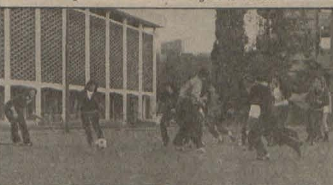
Wanda en Klawerhof in aksie tydens 'n sokkerwedstryd. Hulle het ook kragte gemeet in rugby en hokkie. Die jaarlikse instelling is afgesluit met kerrie en rys.