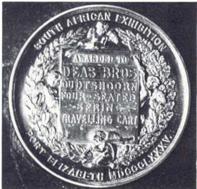
Een van die medaljes wat die Gebroeders Deas op die Port Elizabethse nywerheidskou van 1885 gewen het.

deur 'n eerste prys vir 'n veersitplekkar en 'n eerste prys vir 'n "buggie" op die George-landbouskou van 1886. 11 In die daaropvolgende jaar het die firma drie goue en drie silwer medaljes uit 'n moontlike nege wenpryse op die Oudtshoornse tuinbouskou vir viersitplekverekarre en togwaens verower. 12 Hierna is ook medaljes op die Jubileum-tentoonstelling in Grahamstad (1887), die Oudtshoornse landbouskou in 1891 en die Kimberleyse nywerheidskou in 1892 aan die firma toegeken. In 1893 is 'n tweesitplek-Kaapse kar deur die firma by die Pretoriase skou uitgestal. 14