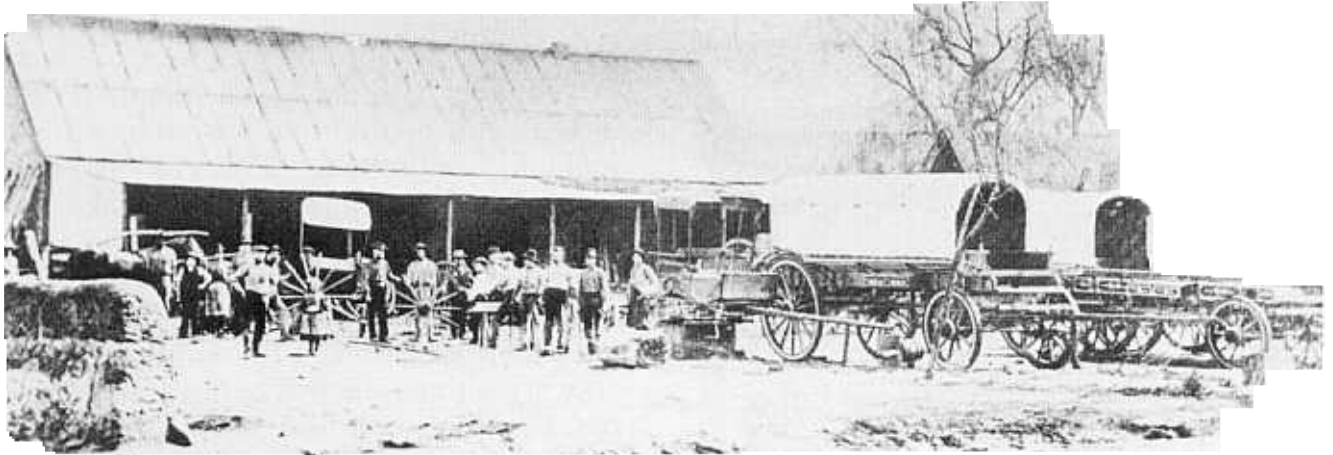
Die wamakery van die Gebroeders Deas in 1880.