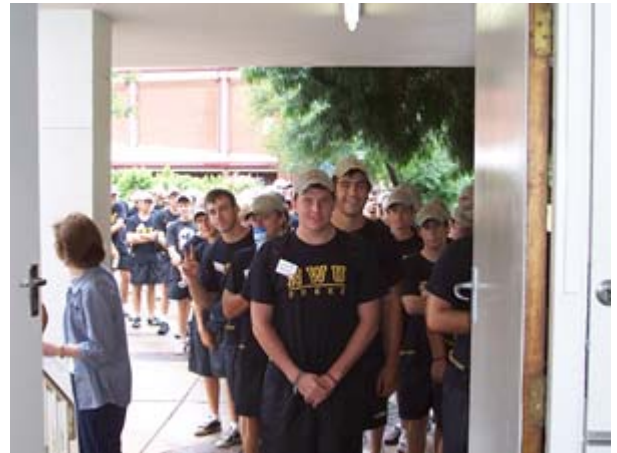
Eerstejaars wag om deur die Biblioteek geneem te word.

As deel van die O&B-program is sowat 4 200 eerstejaars op Donderdag, 22 Januarie, in die Biblioteek ontvang. 25 personeellede van die Biblioteek het gehelp om die eerstejaars in groepe aan die Biblioteek bekend te stel. Die boodskap wat aan die eerstejaars oorgedra is, is dat nuwe studente die Biblioteek nie net sal leer ken as 'n vriendelike omgewing met hope studieruimtes en PC-lokale nie, maar ook as die Nr 1-stop vir alle inligtingsbehoefes.