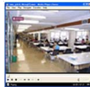
Klik hier vir die inligtingsvideo wat vir die eerstejaars gewys is.