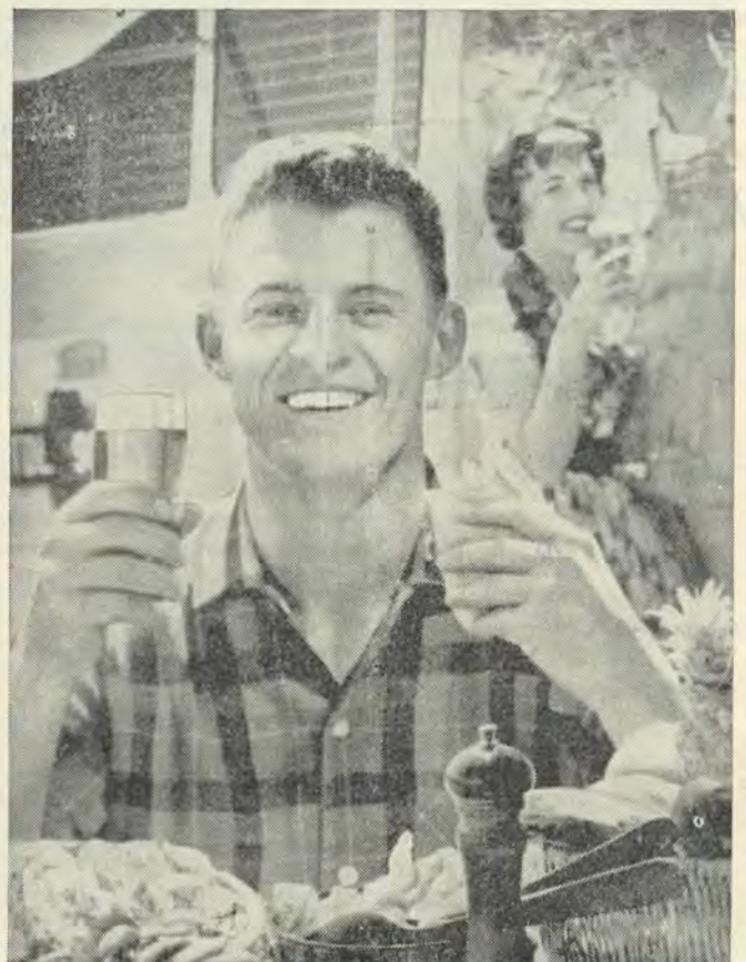
Grant 345/5877 2A