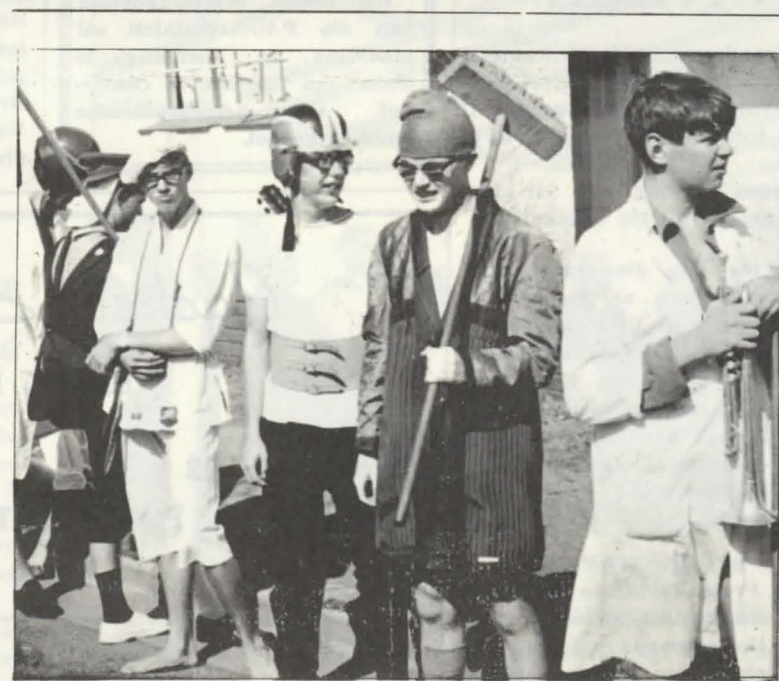
Swierige kostuums was aan die orde van die dag met die ontvangs van Heimat se nuwe ampsmotor, Saterdag. Die motor is amptelik gedoop tot „Campus Queen.”

„Die Bosveld-stollingskompleks is een van ons land se vele geologiese „snaaksighede.” Dit is naamlik die grootste geslaagde indringing in die wêreld en is ons land se belangrikste leweransier van platina, chroom ens. By Thabazimbi kom gebonde ystersteen in die dolomiet van Transvaal-sisteem voor,” het 'n lid van die vereniging gesê.