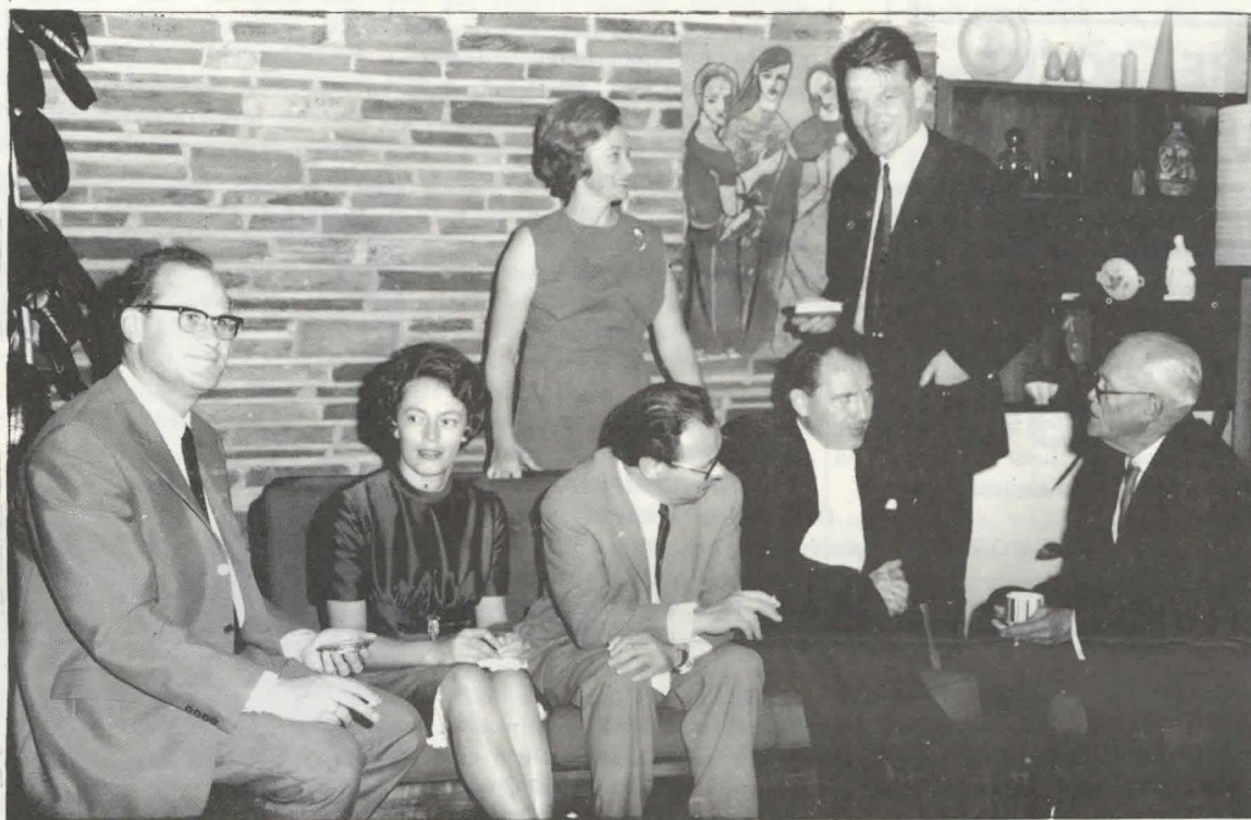
'n Onderonsie van lede van die Kehr-Trio en konsertgangers.