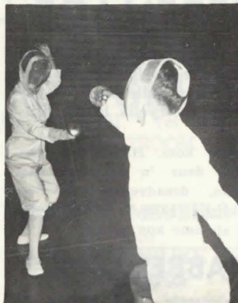
Twee Skermspelers in aksie.