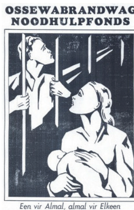
Figuur 2: Amptelike propagandaplakkaat van die OB Noodhulpfonds