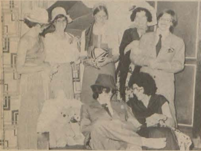
Sleepbanke ingewy. Huisma met sambreel hou toesig.

Na elf lange jare wat gepaard gegaan het met moeitevolle stryd het ons uiteindelik dit gekry - splinternuwe gordyne en meubels.