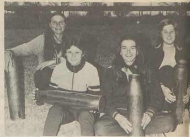
'n Paar PUK-dames van Aster wat 'n besoek aan die w mag gebring het.

wat aangebied gaan word, is van die beste, en beter opleiding as dié wat die S.A. Weermag met sy gespesialiseerde tegniese kennis en puik organisasievermoë bied, kan nie gekry word nie.