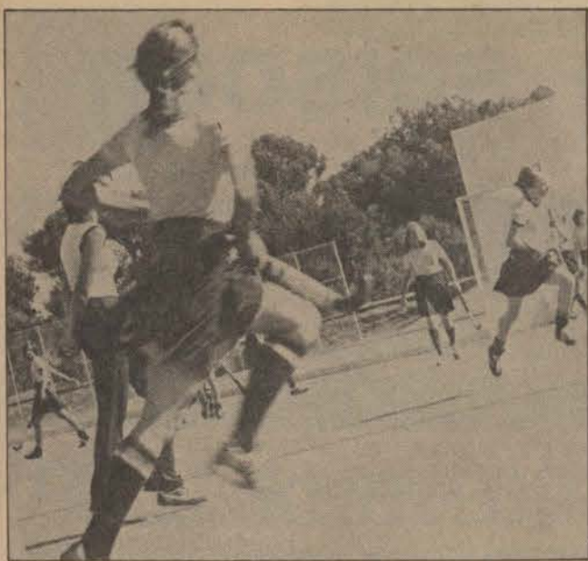
Heide in aksie ...