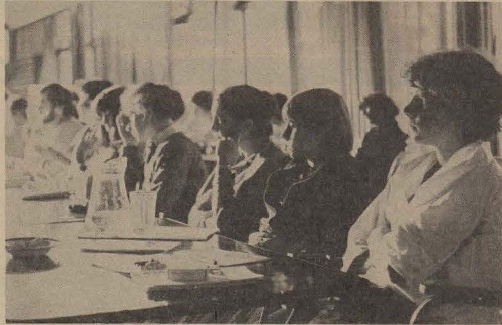
Tydens die skrywersberaad wat van 17 tot 19 April op Mazelspoort gehou is, het hierdie Pukke die besprekings bygewoon.