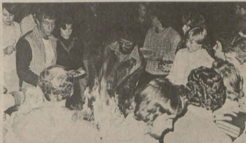
Die Pampoenoere het seker gemaak dat die dames van Vergeet-my-nie nie rou vleis eet tydens 'n braaivleis op Woensdag 28 Mei nie.