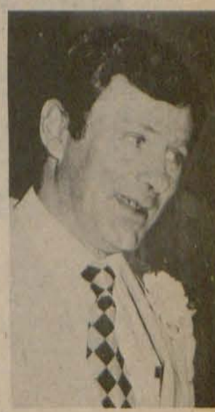
Dr. Van Zyl-Slabbert aan die woord.

blokke moet uit die weg van die bestaande ondernemers geruim word. Die groepsgebiedewet, die Wet op Gemengde Huwelike, Artikel 16 van die Ontugwet en die Paswet strem die bewegingsvryheid van mense en hulle deelname aan die ekonomie en politiek. Dit strem ook rasseverhoudings. Dr. Slabbert het die 12-punt-plan van die eerste minister gekritiseer en gesê dat engeen dit kan interpreter soos hy wil. Die plan van die regering om afsonderlike gebiede en politieke onafhanklike, maar nie selfonderhoudende, state te skep, sien hy as drasties en radikaal en daarom beskou hy homself eintlik as 'n baie konserwatiewe Afrikaner. Al wat hy