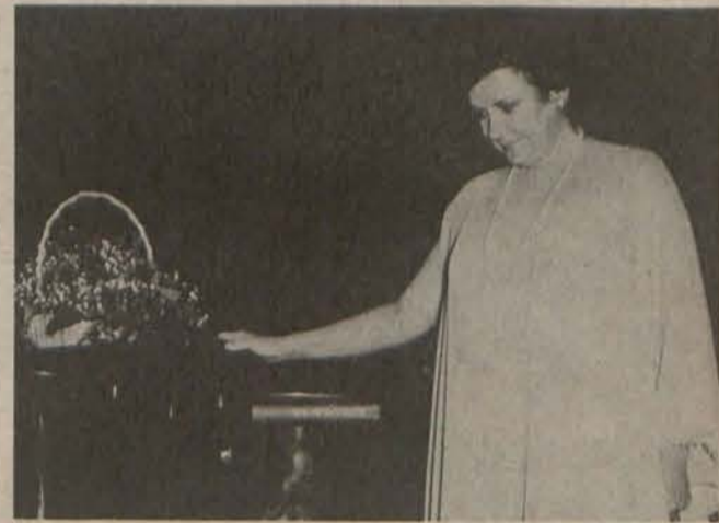
Mimi Coertse tydens haar uitvoering in die ouditorium van die studentesentrum.

Die staande applous ná die immergroen "Heimwee" en "Zwei Schätzli" kon alleen aan mej. Coertse oordra: "Dankie, ons Mimi."