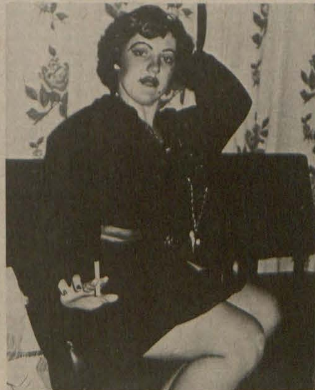
Persoonlikhede soos Sue-Ellen en Marilyn Monroe was teenwoordig.

MODEL-SKOENWINKEL — CHECKERS-SENTRUM en SKOENSENTRUM — KERKSTRAAT