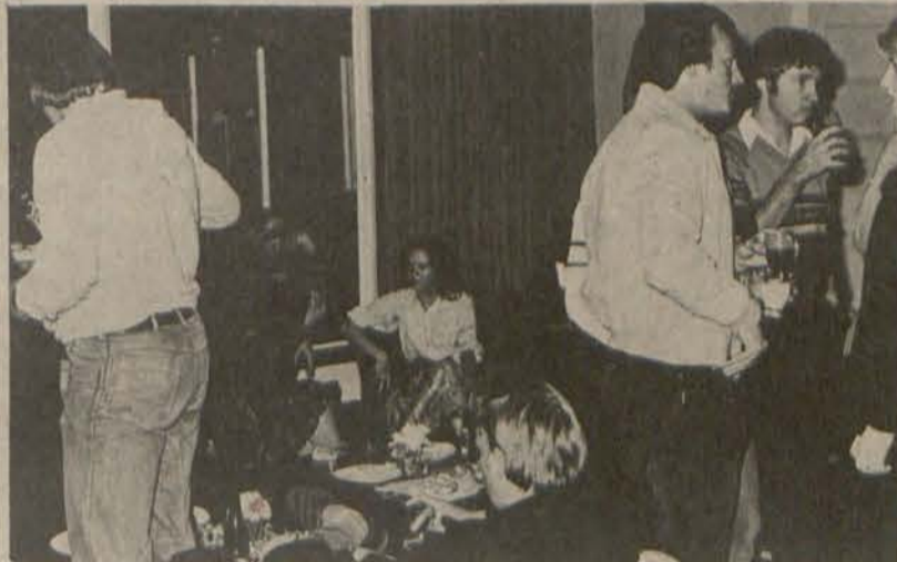
Dinki en Over de Voor tydens 'n aksie.