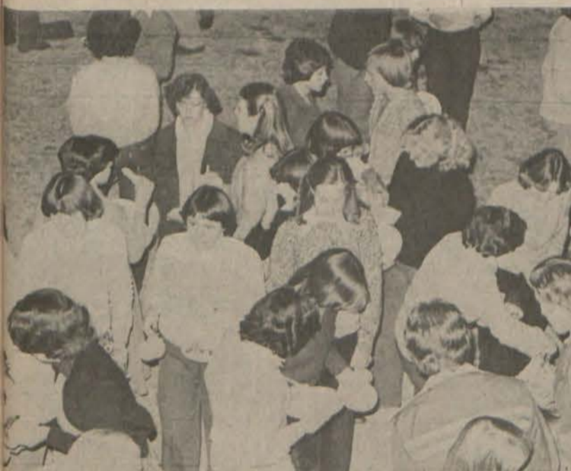
Klooster en Wag-'n-Bietjie verkeer gesellig tydens 'n Braaivleis. Later die aand is vetkoek geëet en 'n film is vertoon.