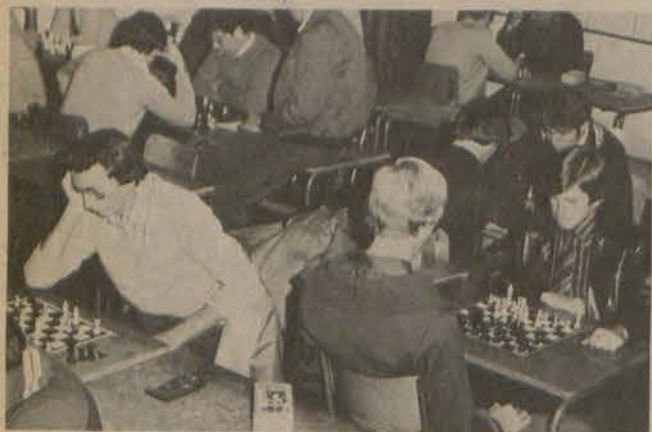
Konsentrasie spreek duidelik uit hierdie foto wat geneem is tydens 'n skaakkompetisie wat deur die PU-skaakklub aangebied is.

Sydney Smith: "Die grootste van alle foute is om niks te doen omdat jy so min kan doen. Doen wat jy kan."