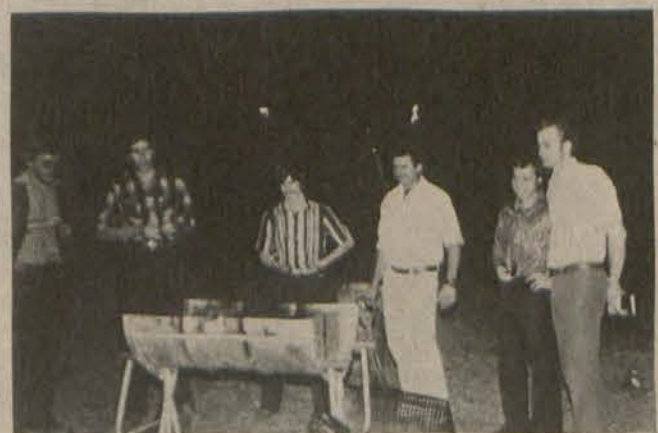
Hierdie is slegs één voorbeeld van die tipe sosiale bedrywigheid wat die ISVP aan die ingenieurstudente wil bied.

Die ISVP beoog ook om 'n afvaardiging van ses studente na 'n SAFUIS-kongres op Stellenbosch te stuur. Die kongres vind plaas van 7 tot 11 Julie. Op die kongres sal probleme rakende die ingenieurstudent indringend bespreek word.