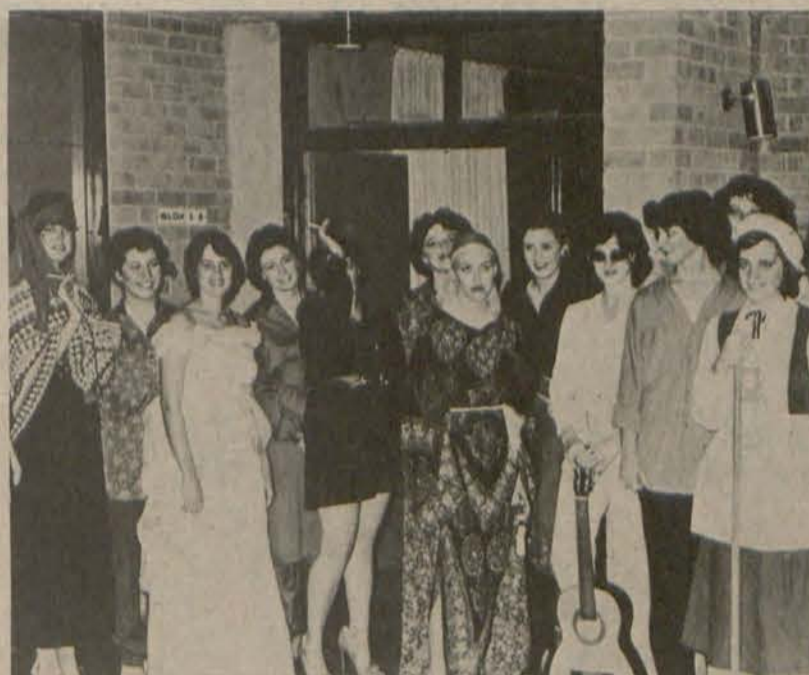
Beroemde internasionale sterre tydens 'n fundu in Wag-'n-Bietjie.