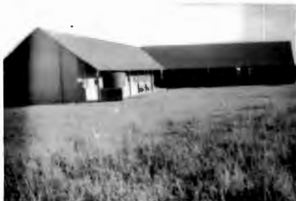
Warmbad. (van agter gesien)