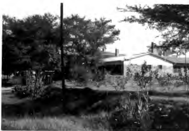
Pres. Kruger-huis. Nylstroom Hoërskool.