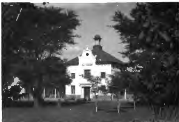
Ons Toekoms. (anneks by seunskoshuis: Nylstroom Hoërskool.