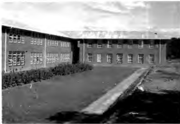
Administrasie-blok van die Nylstroom Hoërskool.