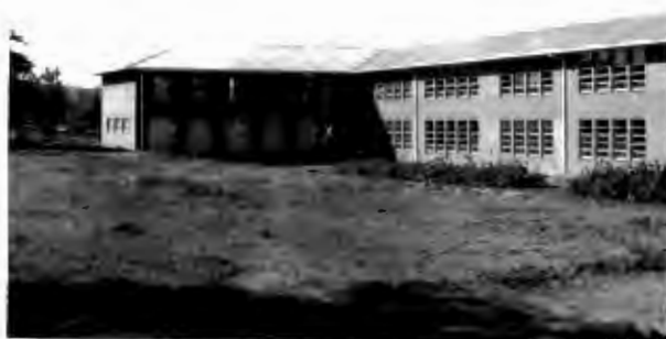
Klaskamers van die Nylstroom Hoërskool.