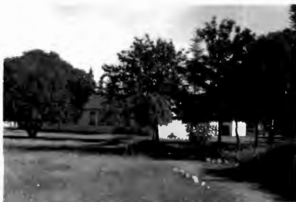
Nylstroom Laerskool. (voorheen Hoërskool).