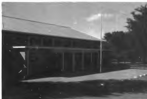
Nylstroom Hoërskool. (skuins van voor gesien).