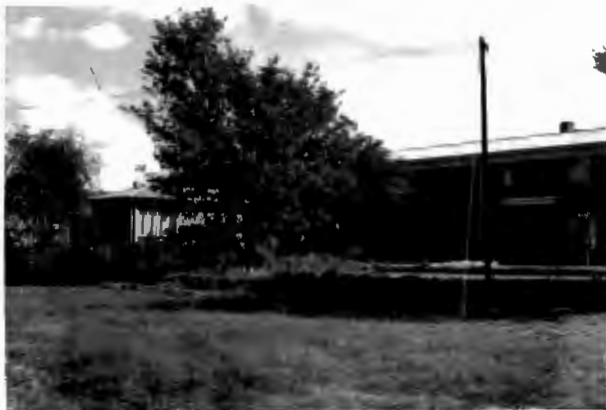
Pres. Steyn-huis. (meisieskoshuis) Nylstroom Hoërskool.