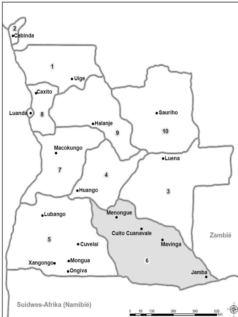
Figuur 1: Angola, Militêre Streke 10