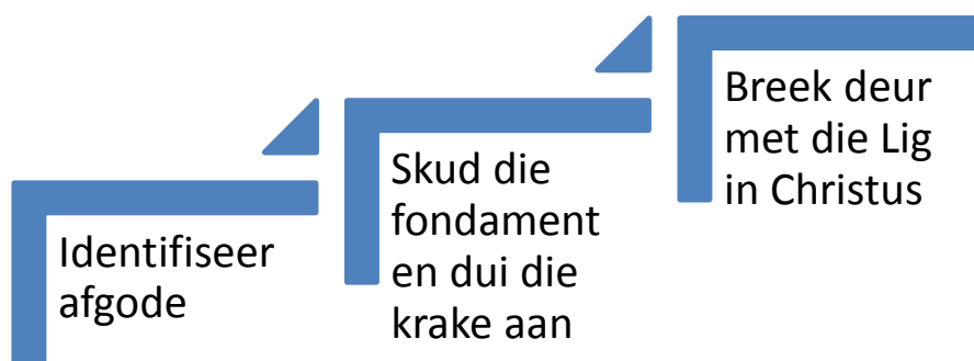
Figuur 4.: Die gevangeneming van die kultuur

Soos reeds gemerk is daar magte en kragte aan die werk soos globalisering, verskuivende demografieë en dies meer wat die kultuur van die dag nie onaangetas laat nie. Verstedeliking bring 'n ontworteling van kultuur mee en vra 'n heroriëntering van gebondenheid aan tradisionele maniere van doen. Die kerk van Christus behoort haarself dus voortdurend te plaas binne die K 1 -6 (Kontekstualiseringskaal) skaal. Sy sal haarself