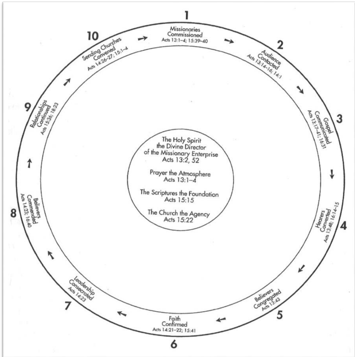
Fig. 1 Die Pauliniese Sirkel aldus Hesselgrave (2000:47)

Hesselgrave (2000:47 e.v.) sit die sirkel uiteen as logiese stappe in Paulus se visie tot uitbouing van die Koninkryk van God: "What were the logical elements (steps) in Paul's master plan of evangelism and church development? ..."