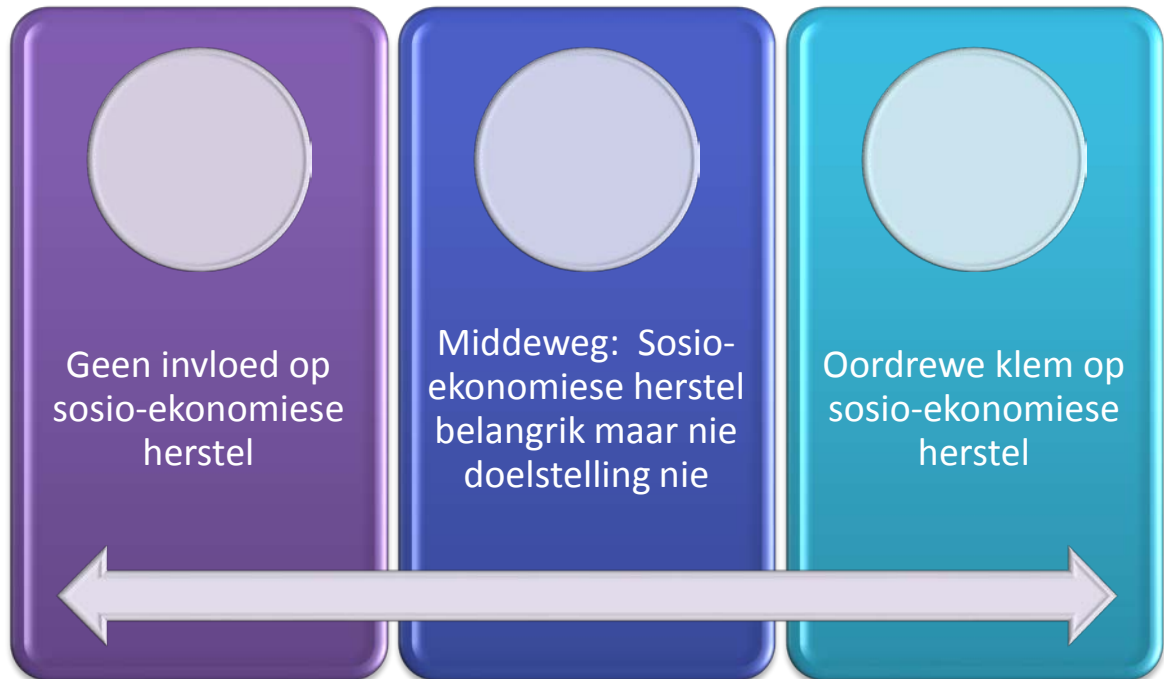
Figuur 2: Sosio-ekonomiese herstel, 'n midde-weg.

gereformeerde lewens en wêreldsbeskouing nooit enige sosio-ekonomiese herstel tot gevolg het nie. (b) die anderkant van die spektrum impliseer dat die sosio-ekonomiese herstel van die samelewing as doel gestel word en die gereformeerde lewens- en wêreldsbeskouing het slegs die instrument geword waardeur sosio-ekonomiese doelstellings bereik word . Vergelyk figuur 2 in hierdie verband: